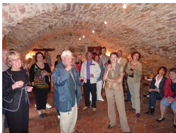
Réception chez Troncy