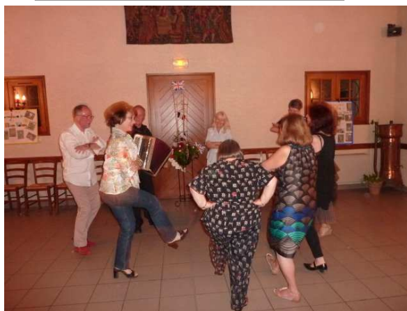
Soirée animée chez Picard