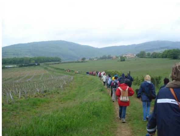
Au milieu des vignes